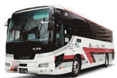
九州号 往復乗車券