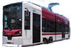
路面電車乗車券 130円×4回分